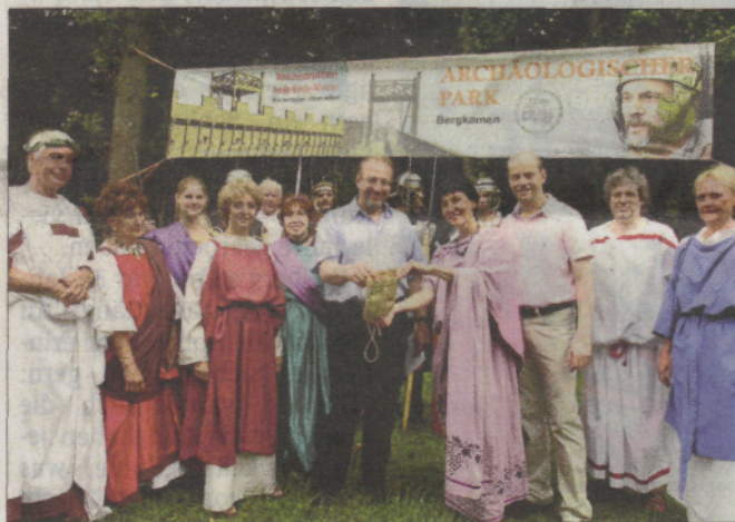
Bisher existiert der Archäologische Park nur als Transparent zwischen den Bäumen im Römerbergwald. Das soll sich ändern.

Dank einiger großer Spenden – unter anderem vom Sparkassenverband und von den Gemeinschaftsstadtwerken (GSW) – hat der Museumsförderverein genug Geld in der Kasse, um noch einige zusätzliche Bausteine zu realisieren. Die Holz-Erde-Mauer soll, wie zu römischen Zeiten, einen vorgelagerten Spitzgraben bekommen. Außerdem ist der Bau einer „römischen Taverna“ geplant. Ein Kiosk, an dem sich zum Beispiel die Radtouristen verpflegen können, die auf dem Weg über die Römer-Lippe-Route am Archäologischen Park haltmachen. In dem Gebäude mit einer Grundfläche von drei mal acht Metern soll es außerdem Sanitäreinrichtungen geben und einen kleinen