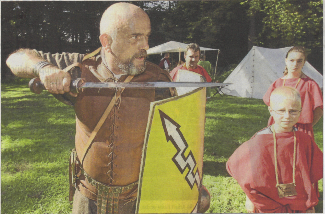
Für römische Spiele wie nachgestellte Gladiatorenkämpfe oder Wagenrennen mit Kindern und für Kulturveranstaltungen soll auf dem Gelände des Archäologischen Parks eine kleine Arena entstehen.